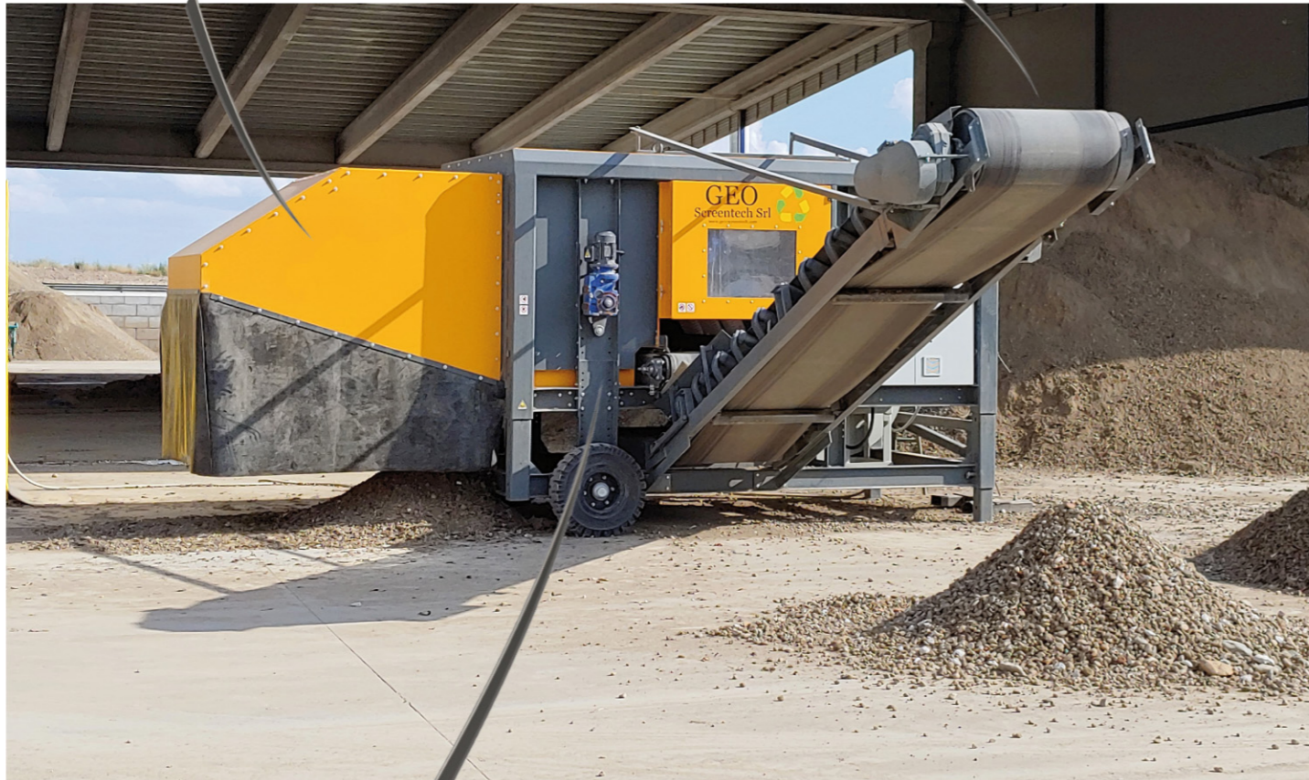
TAMBOR DE SEPARACIÓN