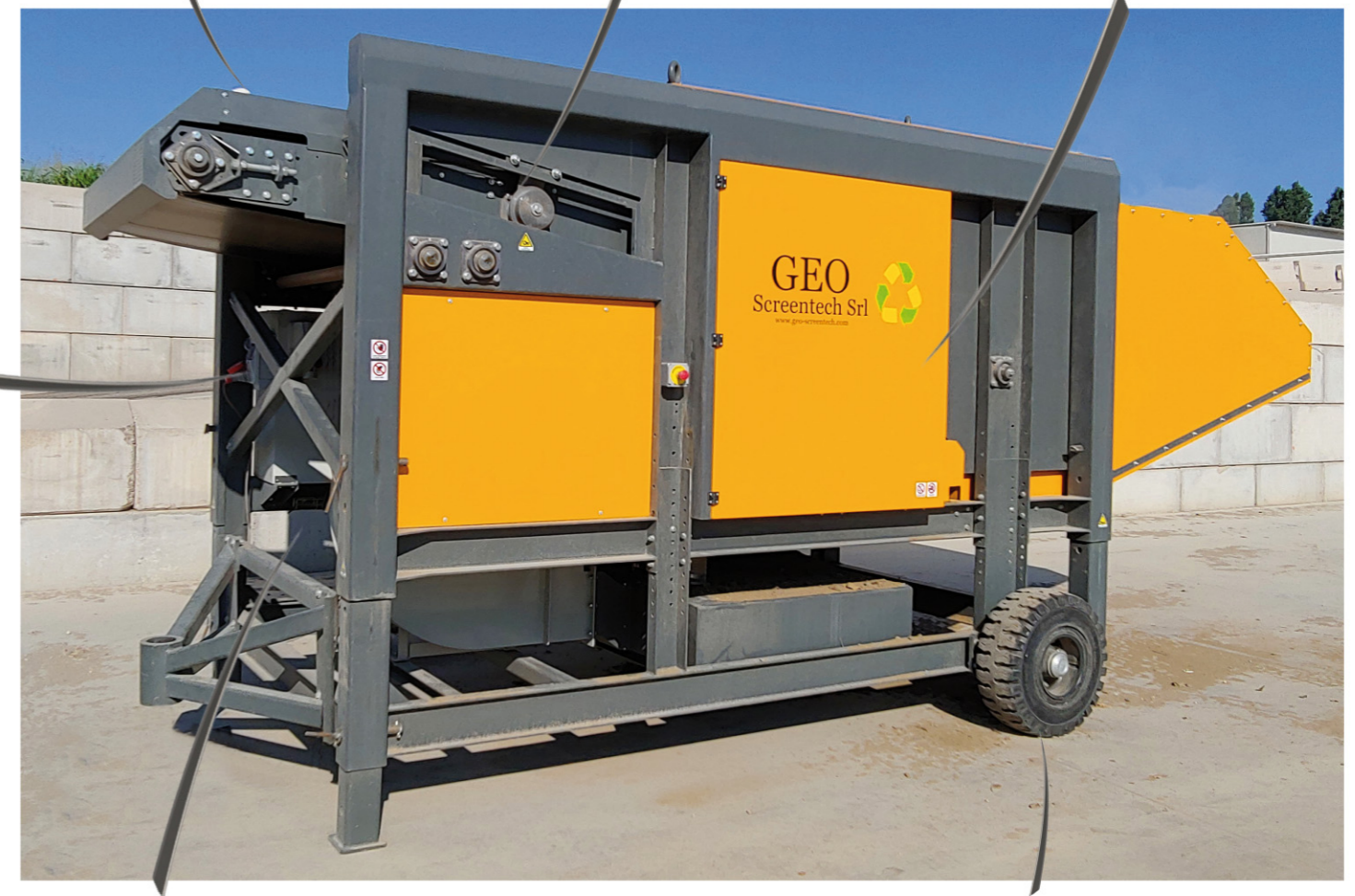
REGULACIÓN DE LA ALTURA